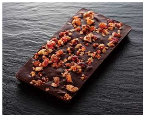
《タブレットフォンダンマンディアンプラス》 (150g) 3,348円 (税込)