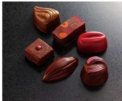
《ヨロイツカファームショコラ・エクアドル》 (6コ入) 2,301円 (税込)