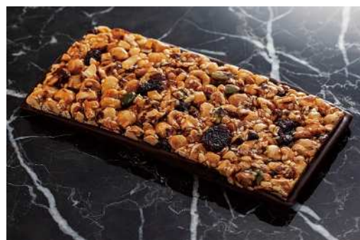
《タブレット ノワゼット ガシュ クランベリー ノワール》 (100g) 2,160円 (税込)