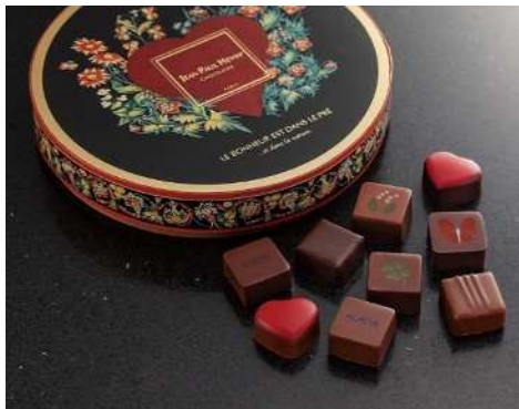
《ボンボン ショコラ フロラ》 (9コ入) 4,985円 (税込)