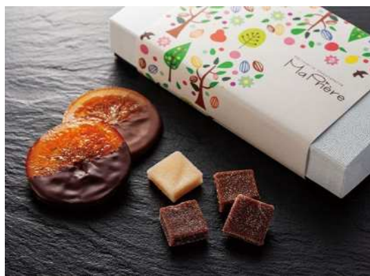
《ジュレドカカオ&オランジュリー》 (6コ入) 2,268円 (税込)