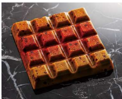
《タブレット ローレーヌ》 (95g) 1,836円 (税込)