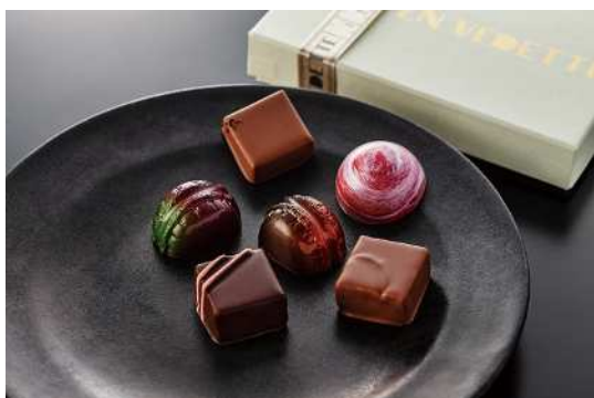
《ショコラセクション6B》 (6コ入) 1,944円 (税込)