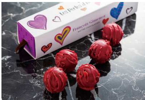
《ベルル・ダムール》 (5コ入) 2,700円 (税込)