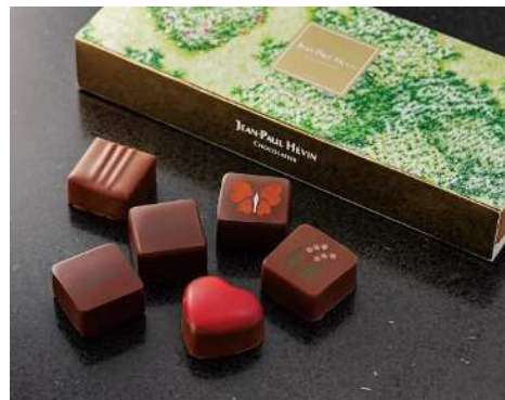
《ボンボン ショコラ ボヌール ダンルプレ》 (6コ入) 2,960円 (税込)