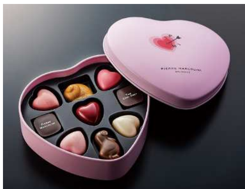
《バレンタインセクション》 (9コ入) 3,672円 (税込)