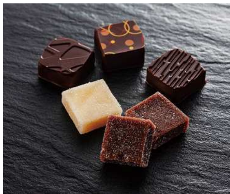
《パカリセクション》 (6コ入) 2,646円 (税込)